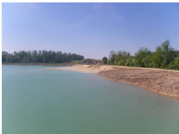
Berge Sud-Ouest du plan d'eau d'extraction, en cours de remblayage avec de fines de lavage et régalee de terre végétale

Conformément à l'arrêté préfectoral d'autorisation n°1801 du 18/07/2014, complété par l'arrêté de prolongation du 10/02/2022, la société a déjà remis en état une grande partie des berges du plan d'eau d'extraction actuel, réalisé des îlots graveleux et modelé topographiquement les sols.