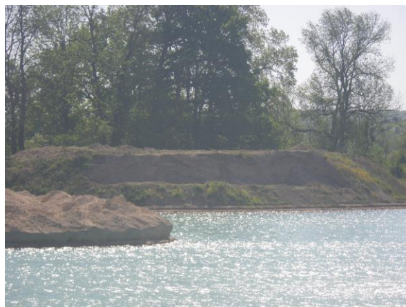
Berge aménagée en faveur des Hirondelles de rivage à l'Est de l'actuel plan d'eau d'extraction.