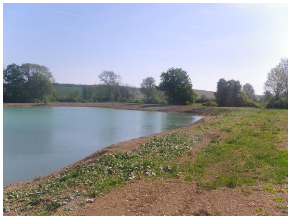
Berge Sud du plan d'eau d'extraction, talutée, régalee de terre végétale et en cours de revégétalisation.