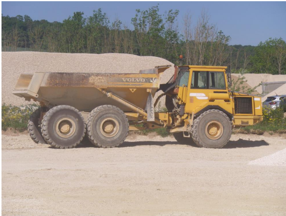
Figure 3 : Chargeur sur pneu, pelle hydraulique et tombereau articulé utilisés pour l'exploitation de la gravière de Lanty-sur-Aube (ENCEM)

La société dispose également de bonnes compétences en gestion de la ressource en eaux. Par exemple, elle dispose d'une installation de lavage qui pompe et rejette les eaux de procédé dans un bassin de décantation, ce qui limite les prélèvements d'eau dans le milieu naturel. Par ailleurs, un suivi qualitatif et quantitatif des eaux est mis en place depuis de nombreuses années et ne met pas en évidence de pollution liée à l'exploitation. Enfin, l'exploitant a une très bonne connaissance du gisement visé par le projet (exploité depuis 2014).