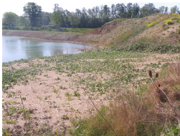
Îlot graveleux mis en place à proximité de l'angle Sud-Ouest de l'actuel plan d'eau d'extraction