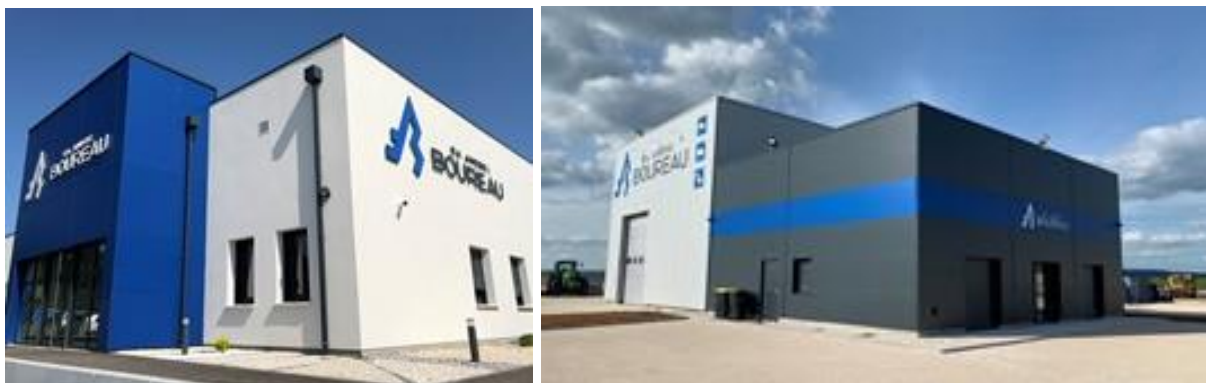
Figure 2 : Siège social de la société ANDRE BOUREAU à Chamarandes-Choignes [à gauche] et son annexe à Châtillon-sur-Seine [à droite]

En Côte-d'Or la société dispose d'un établissement secondaire situé sur la commune de Châtillon-sur-Seine. Deux sites d'extraction sont exploités par la société en Côte-d'Or : la carrière de Prusly-sur-Ource et la carrière de Bousseinois.